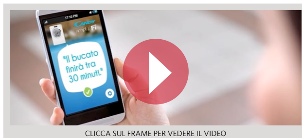
CLICCA SUL FRAME PER VEDERE IL VIDEO

ficare realmente la vita delle persone. Grazie a un'App dedicata l'utente può dialogare con i propri apparecchi per accedere a tutte le informazioni utili e per personalizzarne le funzioni. "Lo spot racconta la semplicità che sta dietro allo sviluppo di questi prodotti, proprio perché nascono dalle vere esigenze dei consumatori e parlano la loro lingua di tutti i giorni, quella dei dispositivi mobile - spiega Stefano Tumiatti , Direttore Creativo Esecutivo di Cayenne -. E l'antitesi tra la complessità tecnologica del prodotto e la sua semplicità d'uso è da sempre alla base del DNA di Candy : migliorare la vita